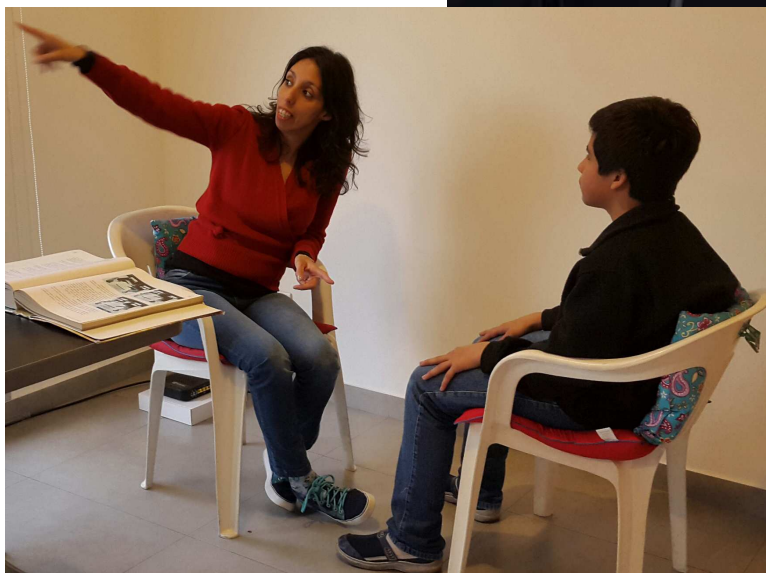
Seminario de TRs