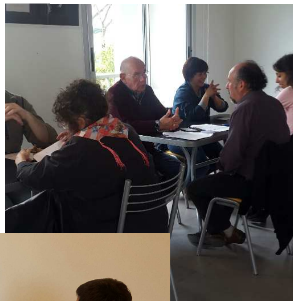
Seminario de la telepatía